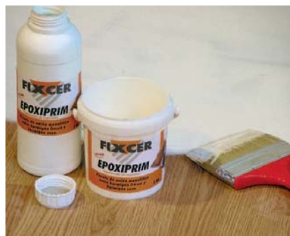
Aplicar un pont d'unió entre fusta i el FIX-NIVEL