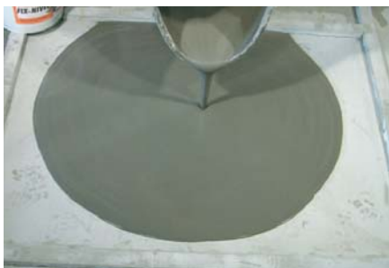
Delimitar el perímetre abans d'aplicar el FIX-NIVEL .