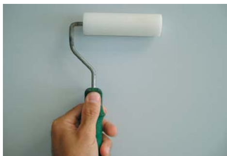
Per aplicar FIX-CERA usar un rodet de lacar.