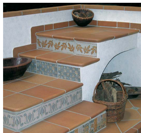
Amb FIX-CERA aconseguim embellir els paviments