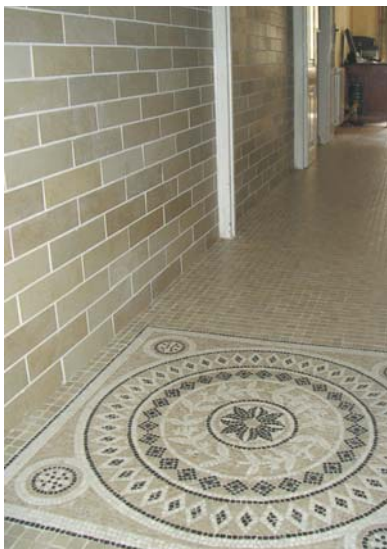
Rejuntado decorativo en todas las situaciones.

Si quedan pequeños restos de producto, en baldosas tipo rugoso, procederemos a la última limpieza pasados 7 días desde el rejuntado, usando ácidos limpiadores tipo