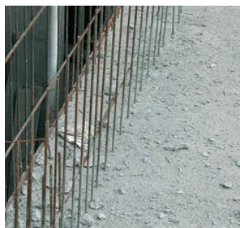
EPOXIPRIM: ideal para unir hormigón nuevo con seco.