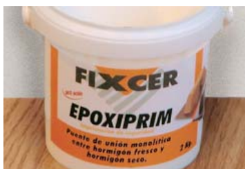
Está disponible en formatos de 2 Kgs. y 6 Kgs.