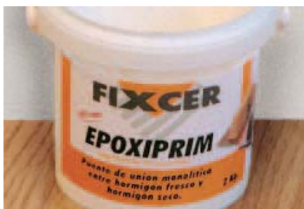
Està disponible en formats de 2 Kgs. i 6 Kgs.