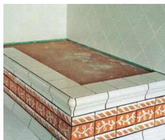
Idéal pour coller sur le bois.