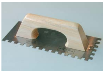
Utiliser une truelle dentée.