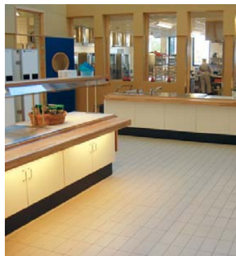
Rejuntado anti-ácido, impermeable e higiénico.