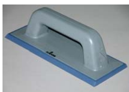
Usar la FIX-ESPÁTULA de goma.