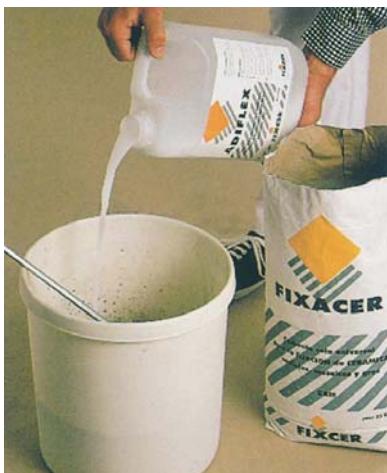
Mesclat amb FIXCER obtenim un adhesiu flexible amb molt altes prestacions.