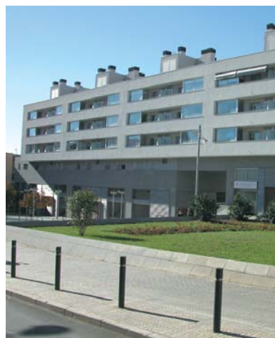
En paviments i revestiments, en interiors i exteriors.

ADIFLEX és un líquid format per polímers en dispersió aquosa que mesclat amb adhesius hidràulics i els seus compostos, els millora la seva flexibilitat, adhesió i resistències a la compressió i flexió.